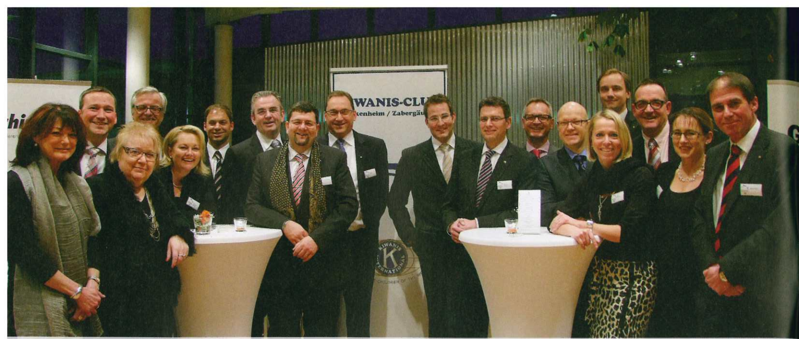
Die Mitglieder des Kiwanis-Clubs Brackenheim/Zabergäu freuen sich über den Erfolg von Benefit 4 Kids.