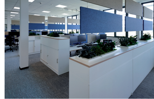
Schreibtische mit Schalltrennwänden ...