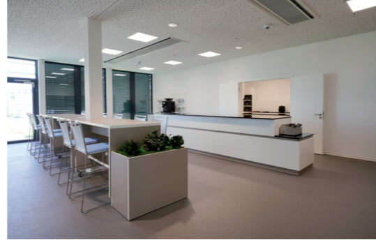
Casino mit Theke, Kaffeebereich ...