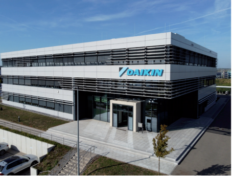
Das Firmengebäude in Leingarten