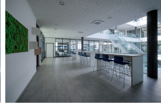
Blick ins offene Atrium