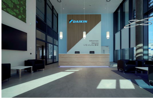
Großzügig und stilvoll gestalteter Eingangsbereich