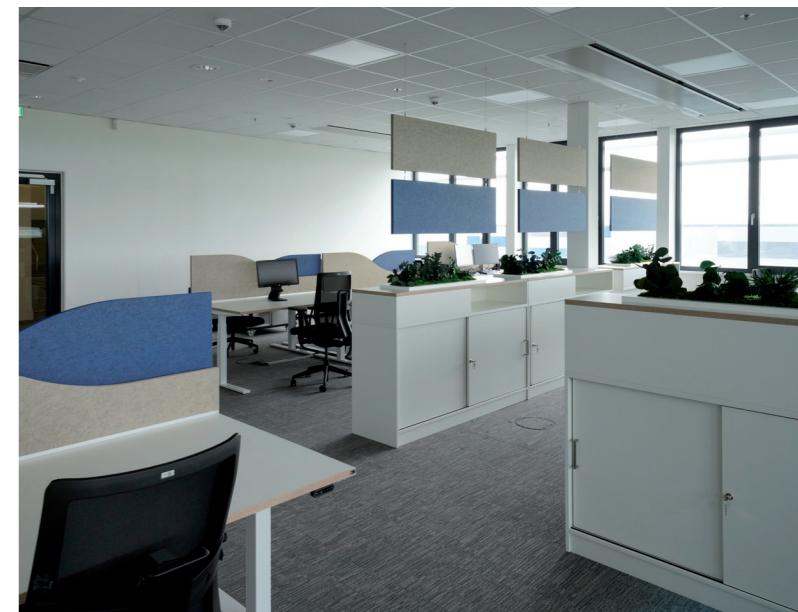
... höhenverstellbar und nach Vorgaben des Arbeitsschutzgesetzes gestaltet