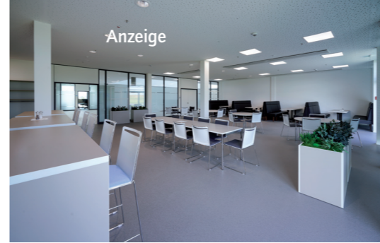
... Esstischen und Lounge